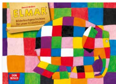
EAN: 426017951 651 David McKee