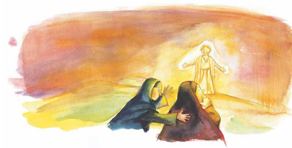
Illustration: Petra Lefin